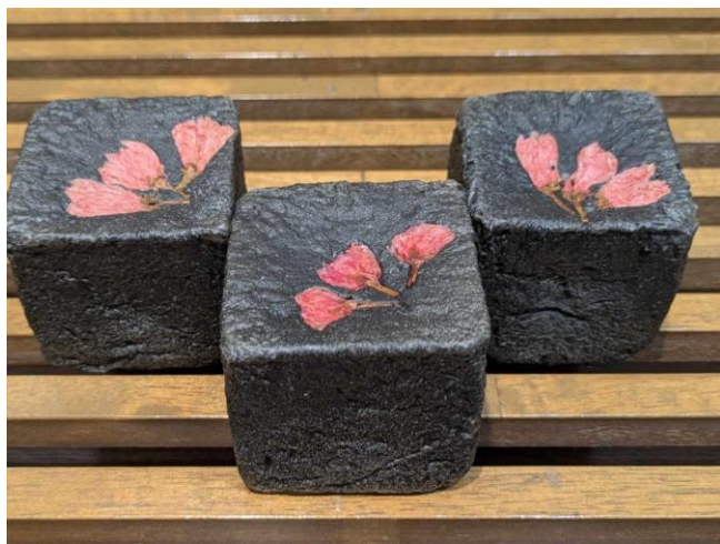
日本をイメージした「夜桜」

光明興業株式会社（大阪市中央区難波4-2-1 難波御堂筋ビルディング11 階）が運営する西紀（にしき）サービスエリアは4月13日～10月13日の間、万博に出展する国をイメージしたパンを販売する企画「パンビリオン」を開催します。