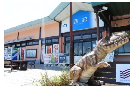
西紀サービスエリア下り線

西紀サービスエリア（にしきサービスエリア）は、兵庫県丹波篠山市の舞鶴若狭自動車道にあるサービスエリアです。舞鶴若狭道唯一のサービスエリアであり、黒豆パンや黒豆ソフトクリームなど販売するほか、ドッグランや24時間営業のショッピングコーナーなどを併設しています。