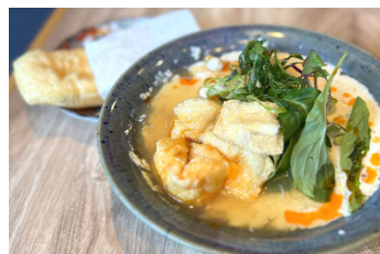
京トウジャン (イメージ)

台湾では朝ごはんの定番「鹹豆漿(シントウジャン)」をイメージし、温かい豆乳スープで作るヘルシーな「京トウジャン」をご用意。揚げパンの代わりにおあげをスープに浸して食べるのがお勧めです。テイクアウトも可能です(容器代別途要)。