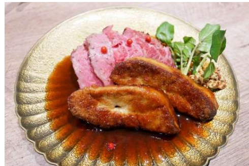
「フォアグラとローストビーフ」(2,178円)