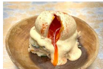
ウフマヨポテトサラダ 638円