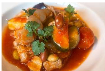
豚肩ロース 南仏風煮込 968円

フレンチシェフが考案した手軽に楽しめるビストロ料理を約50種類ラインナップ。別途、テーブルチャージとして330円頂戴します。