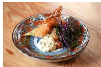
エビの湯葉巻き(1尾) 580円