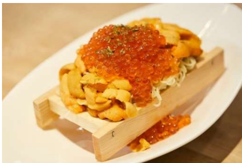
「うにとイクラの冷製パスタ」(2,728円)