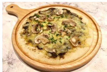
トリュフクリームピザ 1枚1,870円・ハーフ960円