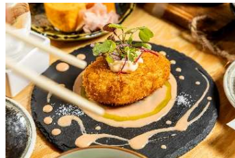
豆腐メンチカツ 880円