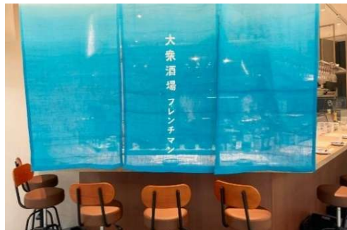
青いのれんが目印の店舗

姫路駅前の商業施設「姫路フェスタ」の地下街「グランフェスタ」に3月14日(金)、気軽にビストロ料理を楽しめる大阪発「大衆酒場 フレンチマン」と揚げたてのおあげが看板メニューの京都発「京とうふ酒場 キツネ日和」が2店同時オープンします。どちらも姫路エリア初出店となります。オープン前日の3月13日(木)に、メディア関係者の方を対象とした試食会を開催しますので、ご取材のご検討をお願い致します。