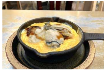
フレンチマンの卵焼き 蒸しカキ 792円