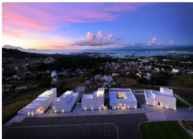
高台から臨む白浜の絶景