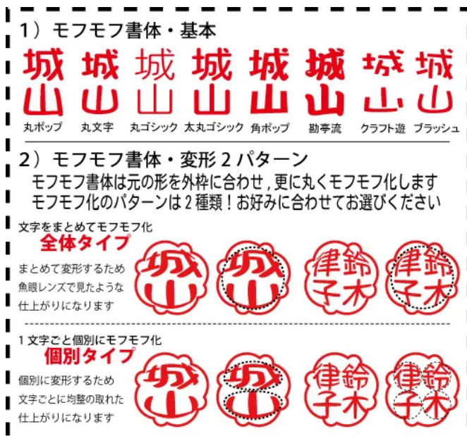
モフモフ書体一覧