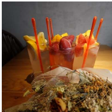
ドリンクもフルーツで可愛く