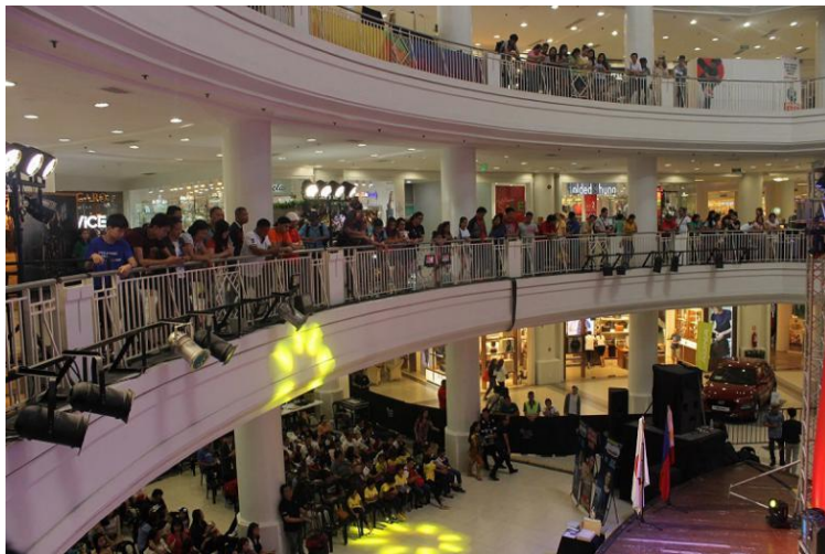
(開演前から立ち見の観覧者でいっぱい)

セブ島では誰でも知っている日英情報誌『SAKURA』で特集されました。 セブ島最大規模のAYALA CENTER (土日の来場数約10万人)の協力で、イベント会場も提供。 音楽学校、地元日本人会、英語学校などにも協力を頂き運営。参加型の日本文化に関するイベントはまだ少なく、地元TV局の取材も入り、初回から大きな話題を呼ぶイベントとなりました。