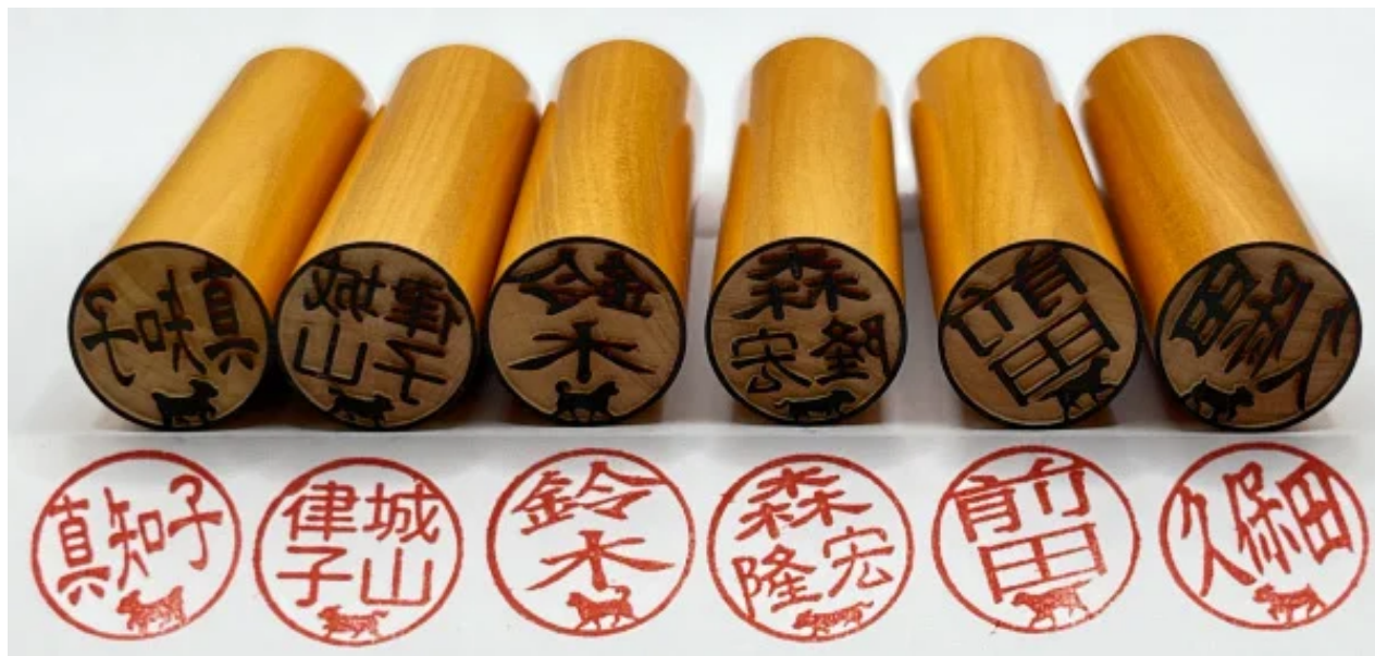
犬の散歩はんこ 印影見本

小さく犬種別に描き分けてもそれと判りやすいデザインにすることができ、本格的な開発を進めることになったのです。