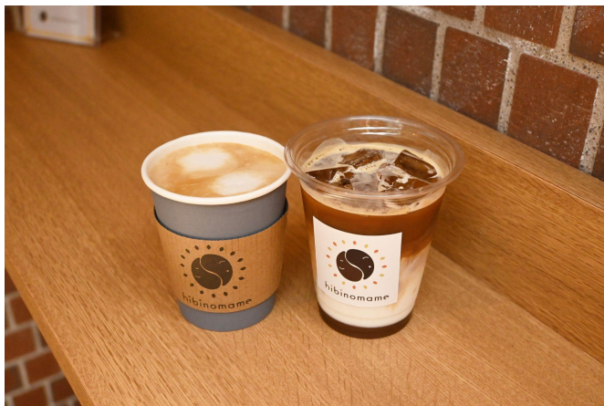
※メディアの方に限り、許諾なく使用して構いません

農園や生産者に少しでも還元できるようフェアトレード、有機認証のコーヒー豆のみを取り扱う「hibinomame」(大阪市北区中崎町)は、より多くの方に当店のコーヒーをお試しいただきたいという思いから、秋らしい季節感たっぷりの「マロンラテ」を販売開始しました。“栗活”はじめをドリンクで、ぜひお楽しみください。