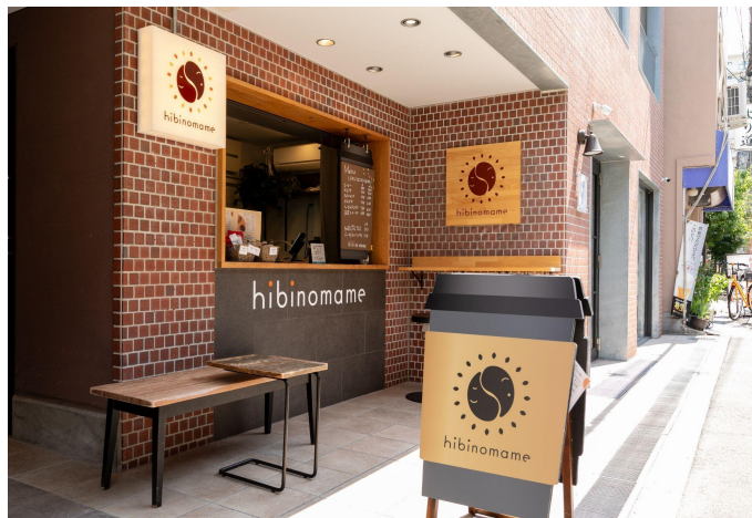
※メディアの方に限り、許諾なく使用して構いません

農薬や化学肥料などの化学物質に頼らず、環境負荷を最小限に抑え自然界の力で生産されたコーヒー豆