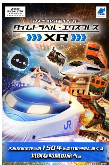
「タイムトラベル・エクスプレス XR」ポスター

大阪駅開業 150 周年記念イベント「大阪駅タイムトラベルステーション～時間の旅へ出かけよう！～」の新コンテンツとなる XR 体験「タイムトラベル・エクスプレス XR」が、大阪駅直結の大阪ステーションシティ 5 階「時空の広場」で 9 月 13 日（金）から 11 月 4 日（月・祝）までの期間限定で開催いたします。