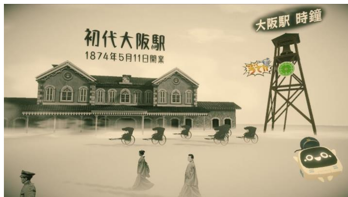
「ジェルピ」とともに歴代の大阪駅舎を巡る

「タイムトラベル・エクスプレス XR」は、世代を超えて幅広い方々に体験いただける XR 体験を通して、150 周年を迎えた大阪駅の歴史や未来、時代を象徴する人気列車に触れていただき、興味・関心を高めようと開催する没入型イベントです。