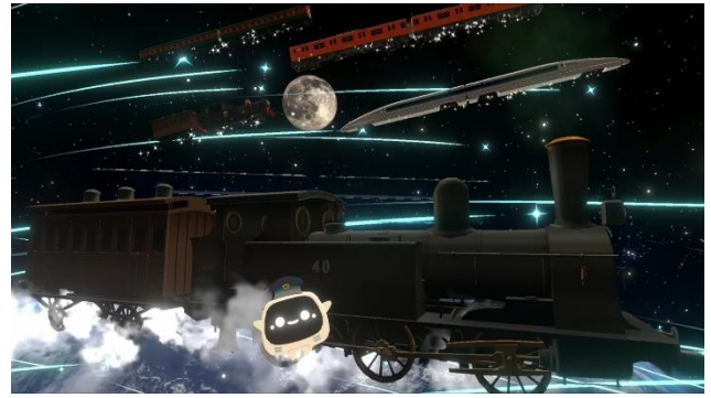
宇宙空間に歴代列車が登場