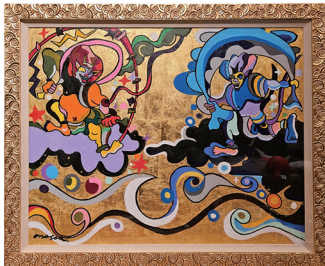
左/NEW OSAKA八百八楽 右/笑う金の風神雷神