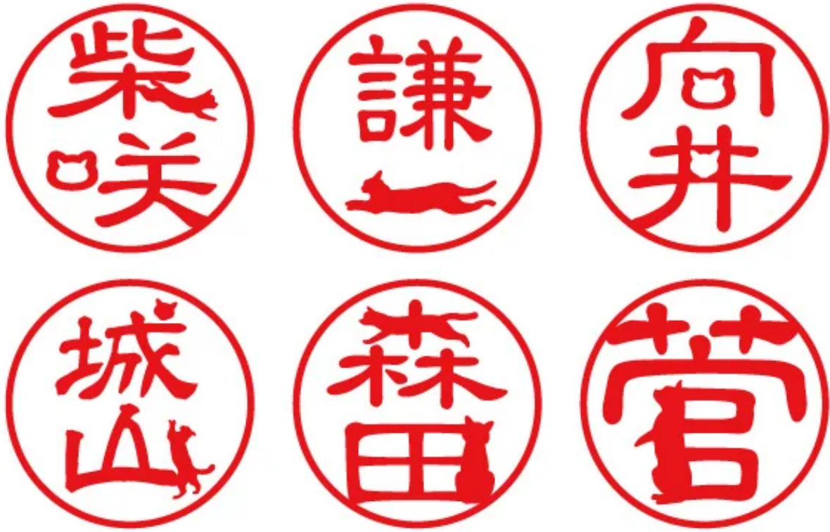
ニャン鑑 デザイン見本