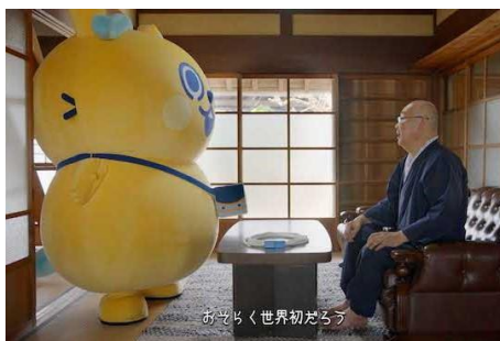
職人のもとを訪ねるびりーばー

本企画に合わせ、プロモーション動画も作成しました。お子さまに電車ごっこをしたいとねだられたお父さんが簡素な紐しか持ってならず、代わりにびりーばーが「電車ごっこヒモ」職人のもとへ訪れて作ってもらい、“本気の”電車ごっこヒモをお父さんに届けるというストーリーで展開されます。