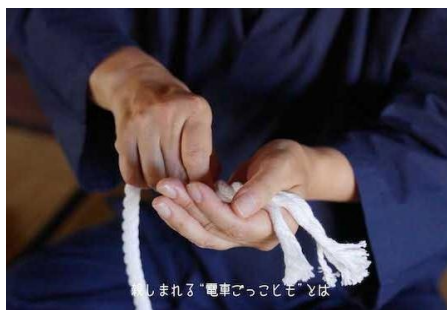
職人による電車ごっこヒモ制作