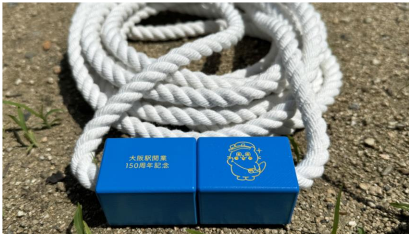
JR西日本オリジナル電車ごっこヒモ

西日本旅客鉄道株式会社は8月5日（月）～10月31日（木）の間、JR大阪駅開業150周年を記念したクイズ企画「大阪駅歴史ヒモ解きクイズ」をコミュニケーションアプリ「LINE」上で実施します。JR大阪駅にまつわる内容で、思わず「へえ～！」とうなる問題も。全問正解者の中から抽選で150名様に、「JR西日本オリジナル 電車ごっこヒモ」をプレゼントします。磁石ギミックを採用し、ドアの「開閉感」を再現した渾身のアイテムです。