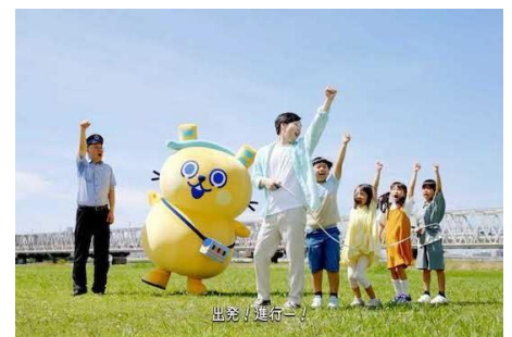
みんなで電車ごっこ！