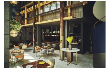
レストラン 古材を使った内装デザイン