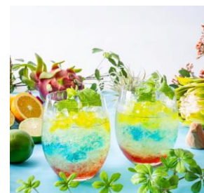
アフタヌーンティー「トロピカルオアシス」左から1段目、2段目、3段目、モクテル