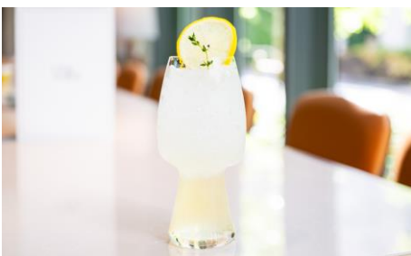
LOKAL HOUSE レモネード