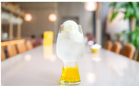
LOKAL HOUSE メロンクリームソーダ