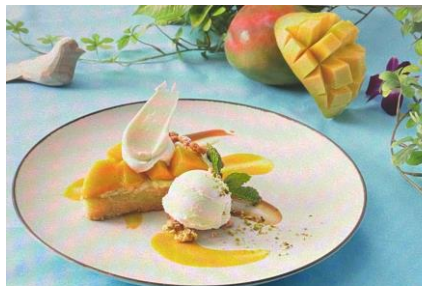
マンゴーココナッツタルト