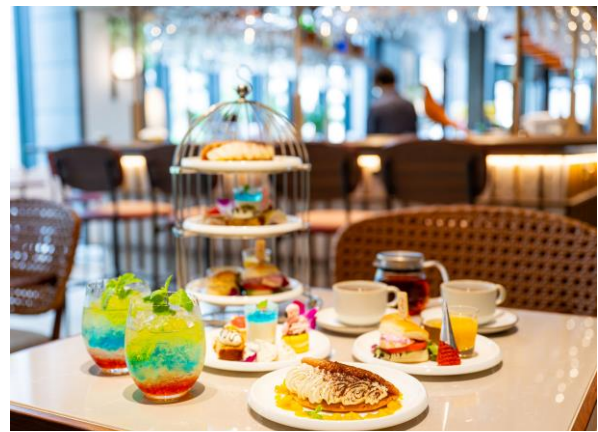
カフェ&amp;バー イメージ