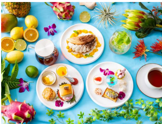
アフタヌーンティー「トロピカルオアシス」

明るくて華やかな雰囲気、そして自然の中でリラックスできるようなイメージから、「トロピカルオアシス」と名付けました。フラミンゴがモチーフのスイーツもトロピカルな雰囲気とぴったりです。また、大阪ハニーを使ったオリジナルのレモネードと大阪産メロンシロップのメロンクリームソーダも新登場。さらに、爽やかな味わいで夏にぴったりのマンゴーココナッツタルトやコーヒーゼリーなど、地元大阪の味覚と夏を感じるスイーツやドリンクが充実したカフェ&バー「LOKAL HOUSE」で、2024年の夏をお楽しみください。