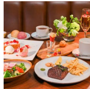
バラ尽くしのディナーコース

メインは、150gのアンガス牛赤身肉のグリル、またはヴァンブランソースが添えられた150gの鯛のソテーからお選びいただけます。バラの季節限定の料理と共に特別な夕食をご堪能ください。