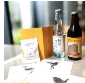
開業1周年記念特別プレゼントセット