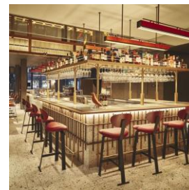
カフェ&バー イメージ

この機会に、特別なひとときを当ホテルでお過ごしください。 皆さまのご利用を心よりお待ちしております。