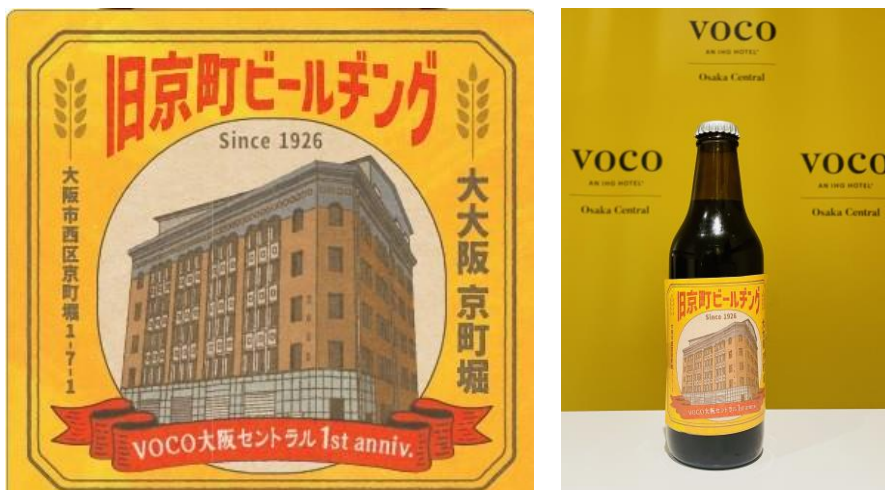
「旧京町ビル」をデザインしたオリジナルラベル と クラフトビール

voco 大阪セントラル(所在地:大阪府大阪市西区京町堀 1-7-1、総支配人:穴倉大地)は、開業1周年を記念し、2024年5月30日(木)に宿泊いただいたお客様を対象に、クラフトビール「旧京町ビールディング」、「無添加 大阪ハニーのぶんぶんナッツ(オリジナル)」、「桜川サイダー」、「voco オリジナルポストカード」をセットにした特別なプレゼントをご用意しております。