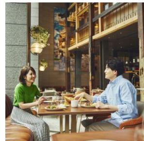
レストラン朝食 イメージ

voco 大阪セントラルで人気の朝食付きプランをお得にご利用頂けるプランです。ブッフェテーブルから、グリル野菜、フルーツ、パン、ホット&コールド料理など、好きなメニューを思う存分お楽しみいただける朝食を素泊まりプランに+1円でお付けした期間限定の特別な宿泊プランです。大阪京町堀の魅力あふれる街で、朝食から幸せなひとときをお過ごしください。観光地へのアクセスも便利で、滞在を快適に演出します。全てのゲストルームには、リラックスタイムをさらに特別なものにする上下セパレートナイトウェア、ネスプレッソマシンで淹れるコーヒー、ロンネフェルトのお茶、ホットチョコレート、お茶菓子などをご用意しています。ご自宅のように、お部屋でお寛ぎいただけます。