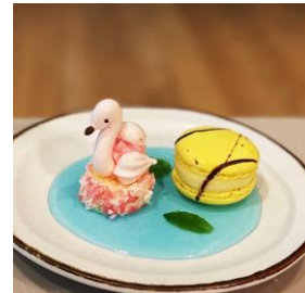
プレゼントのデザート イメージ