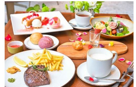
バラ尽くしのランチコース