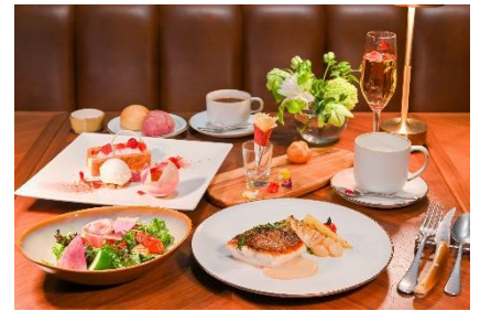
バラ尽くしのディナーコース

朝食は、和食の3段重、または洋食の卵料理からお選びいただけ、さらにbuffetボードからお好きなものをお好きなだけお召し上がりいただけるセレクションbuffetをご用意しています。