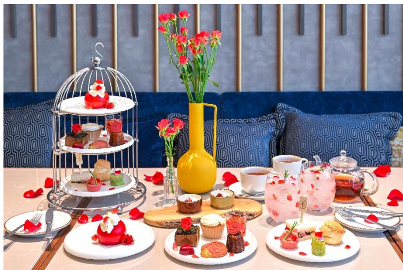
カフェ&バーで提供するアフタヌーンティー

カフェ&バー「LOKAL HOUSE」では、3段のスタンドで“バラ尽くし”のスイーツ7種とセイボリー4種をご提供いたします。