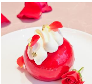
上段 バラの華やかさを表現したムース