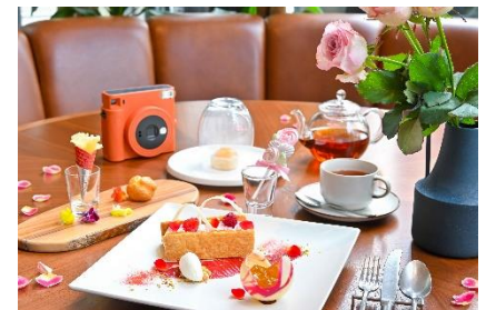
感謝の気持ちを伝える“母の日”