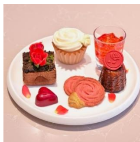
中段 バラがテーマのスイーツが並ぶ