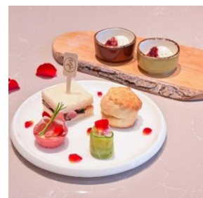
下段 バラや春の食材のセイボリー