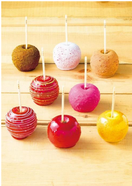
カラフルなりんご飴を提供

https://prtimes.jp/main/html/rd/p/000000138.000129774.html