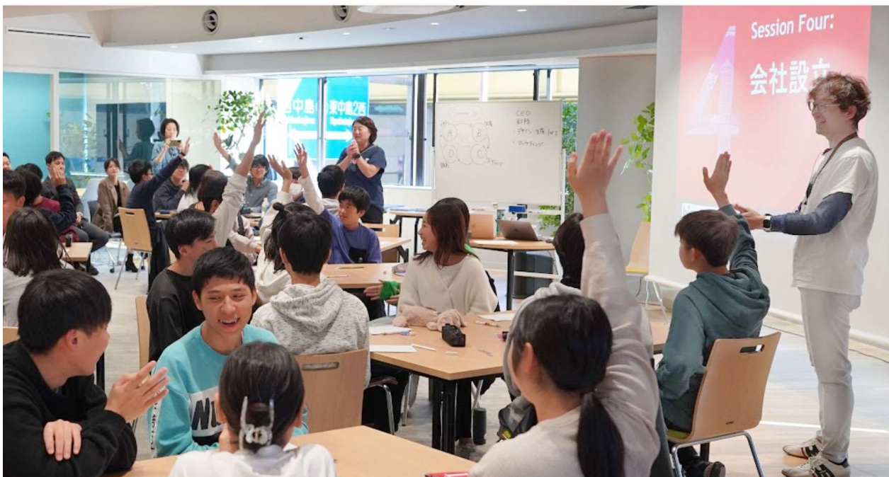
写真1 こども起業塾 体験会の様子

株式会社類設計室（本社：大阪市淀川区、社長：阿部紘）の教育事業部「類塾」は、アメリカ発祥のアントレプレナーシップ教育 BizWorld を日本で提供する IKIRU 合同会社(BizWorld Japan) と連携し2024年3月16日に「こども起業塾 with BizWorld」を開講します。学習塾でプログラムを行うのは全国初。新たな価値を創造する時代。自らが問いを立て解決する力、仲間と協働して実現する力を育て、事業をつくりあげていく面白さを体感するプログラムを提供します。