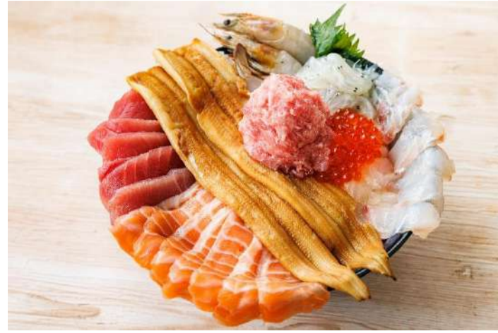
ふくしま海鮮丼全部のせ メガ盛り