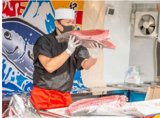
贅沢生マグロ3種丼