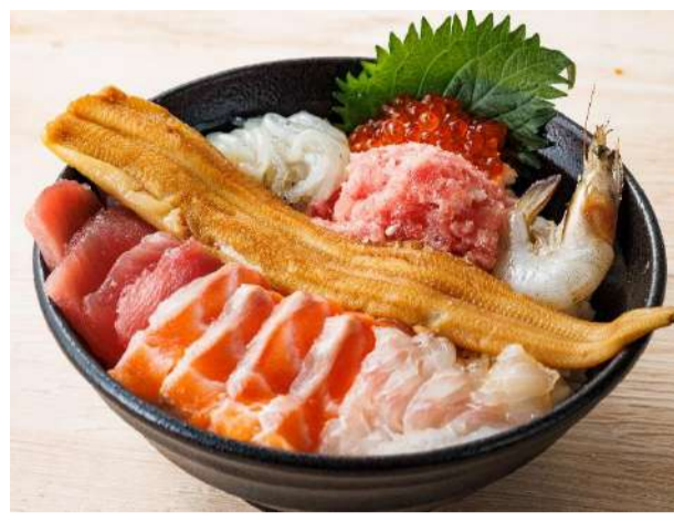
ふくしま海鮮丼全部のせ 普通盛り