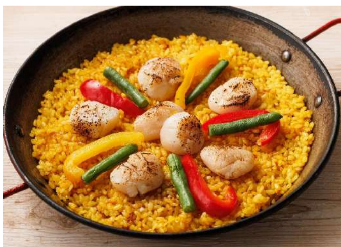
北海道産ホタテの大鍋パエリア