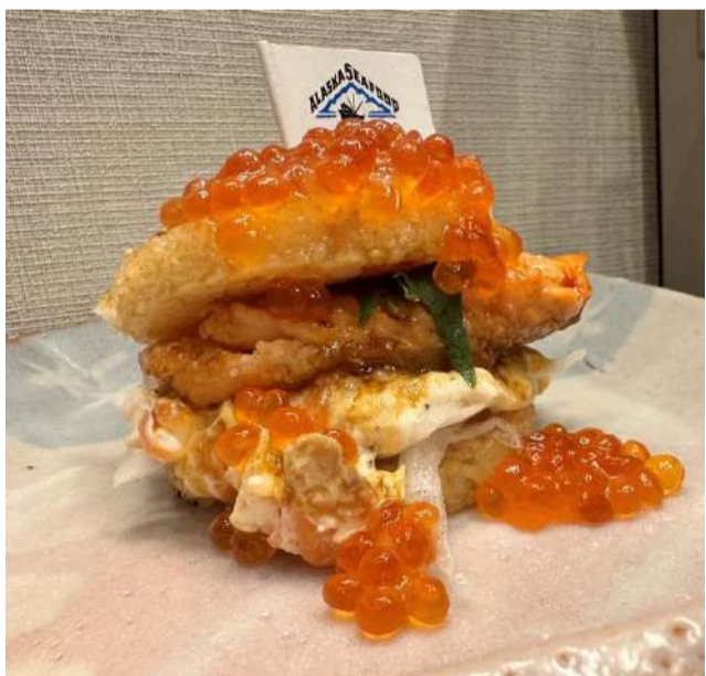
アラスカ産銀だら西京焼と かき揚げの最強ライスバーガー