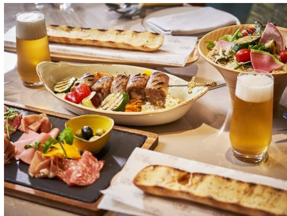
こだわりのメニューをコース仕立てで提供