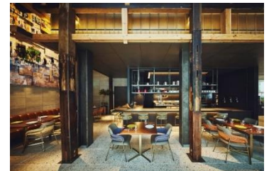
LOKALHOUSE 古材を使った内装デザイン