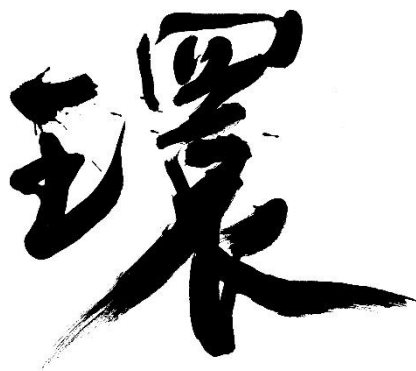
20周年キャッチコピー「環:MEGURU」

「古:過去」と「今:現在」の在り方を大切にしてきた、COCON KARASUMA(古今烏丸)。20周年を迎えるにあたり、めぐることから生まれる、新しい「未来」への想いをキャッチコピーとロゴデザインに込めました。