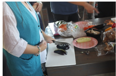
(宿泊して当事者同士が教えあうリハビリ合宿を主催)