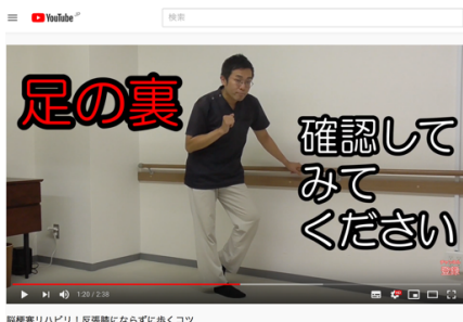
(YouTubeチャンネル総再生回数589万回超)