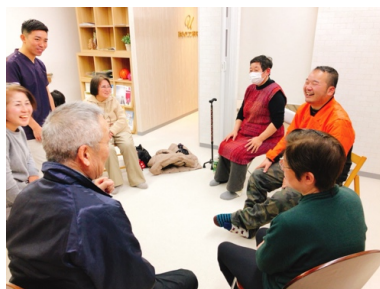
(脳卒中当事者会:未来へつなぐ会を毎月開催)