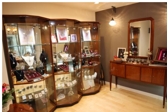
これまで手掛けたジュエリーがずらり