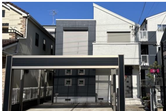
宝飾店とは思えない隠れ家のような存在に