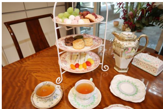
サロンではアフタヌーンティーなど提供