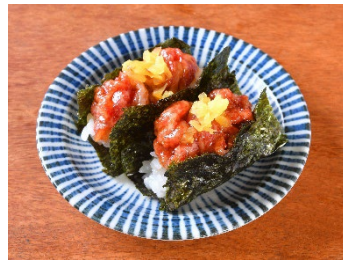
炙り和牛とろたく 250円