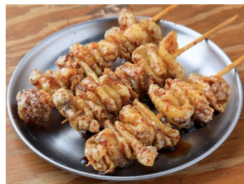
どぶ漬け鶏皮串 50円