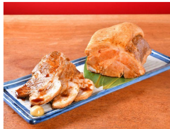
切りたてチャーシュー 380円