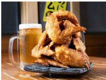
名物 手羽先 90円

八銭のお料理は、200~300円を中心に全て1,000円以内! ※価格は全て税抜