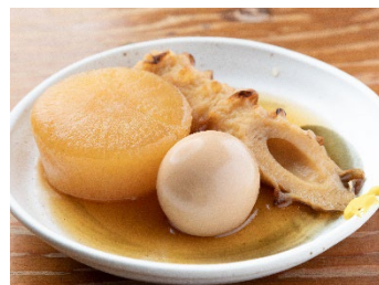
おでん 3種盛り 320円