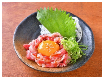
和牛炙りユッケ 680円