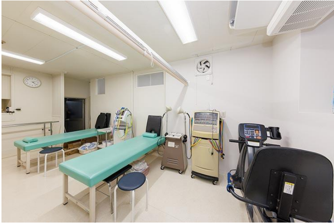
1階リハビリテーション室