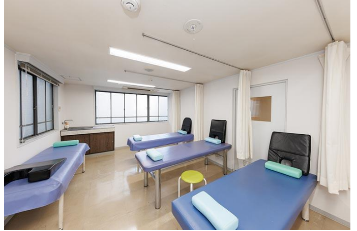
2階リハビリテーション室