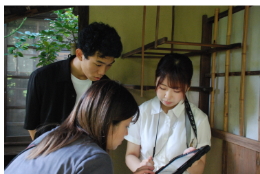
上林春松本店での撮影の様子