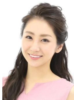
田中梨乃 タレント・女優 日本酒唎酒師