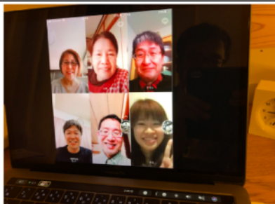
オンライン脳卒中当事者会