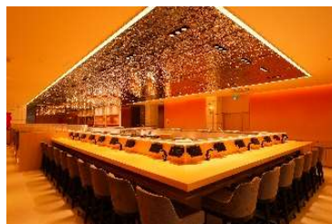
※「廻転鮨 銀座おのぞら本店」内観

URL : https://onodera-group.com/kaitensushi-ginza/