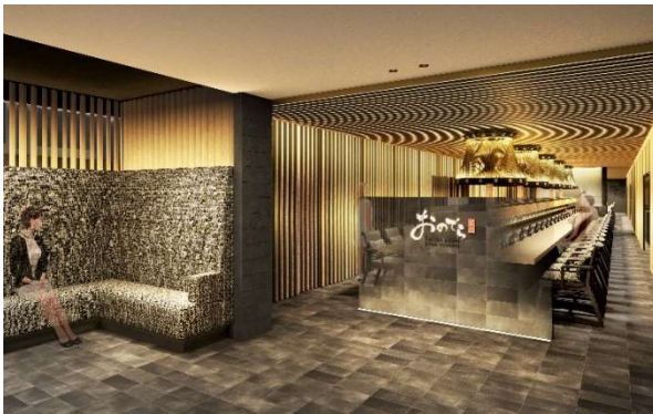
※「廻転鮓 銀座おのぞら 京都店」内観完成イメージ CG

7月28日（金）グランドオープン予定！関西初出店「廻転鮓 銀座おのぞら 京都店」 内装デザインは GLAMOROUS co.,ltd. 森田 恭通 氏 ～ミシュラン星獲得「銀座おのぞら」が展開する、廻転鮓業態国内2店舗目～ 【メディア内覧会開催】7月26日（水） ①10時30分～ ②13時～ 申し込みフォーム： https://forms.gle/8UzdUvcFRedtEkKa7