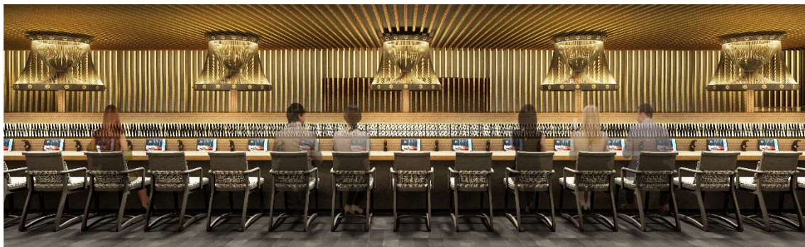
※「廻転鮨 銀座おのぞら 京都店」内観完成イメージ CG

法を用い、現代工芸による素材や照明計画を採用することによりラグジュアリーでハイセンスな空間を演出し、「銀座おのぞら」が紡いできたホスピタリティの精神を、くつろぎの時間と共に体感できる唯一無二の店舗が誕生いたします。