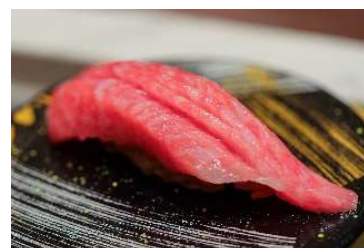
※やま幸本マグロ大トロ