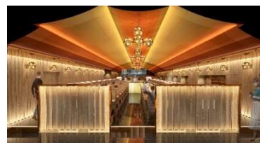
※「廻転鮨 銀座おのぞら 大阪店」内観完成イメージ CG