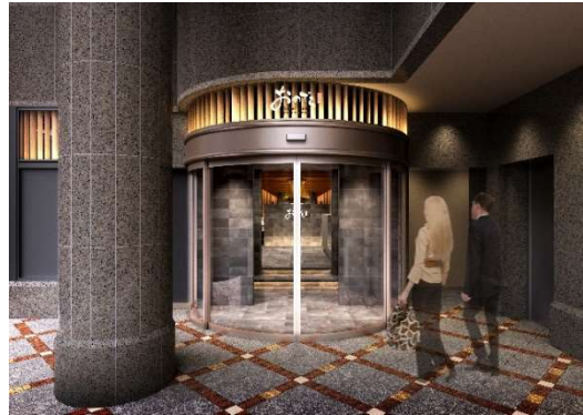
※「廻転鮓 銀座おのぞら 京都店」エントランス完成イメージ CG