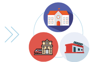
学校施設や鉄道・地下鉄の駅、各連携商業施設へパンフレット設置