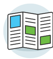
イコロ提供店舗、サービス、イベント、公演情報をまとめたパンフレット作成

住之江区の学校施設や鉄道・地下鉄の駅、連携商業施設への設置によって、すべての住之江区民に情報を届けていきたいと考えています。