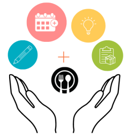
食事の提供だけでなく、文房具や体験活動も