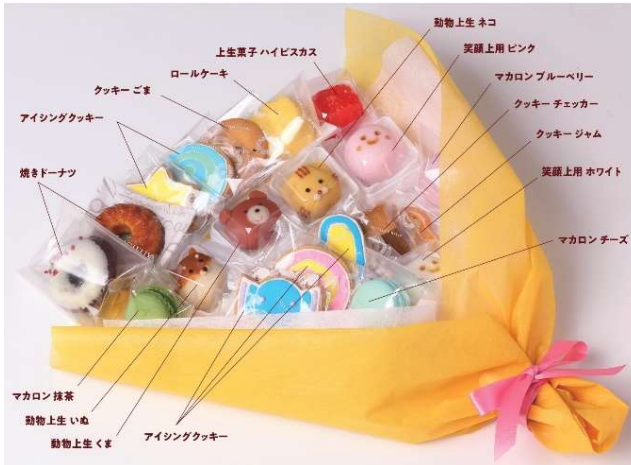
職人3人でイラストを再現したお菓子