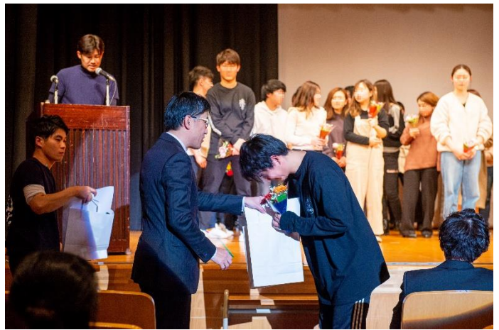
「卒店式」開催の様子