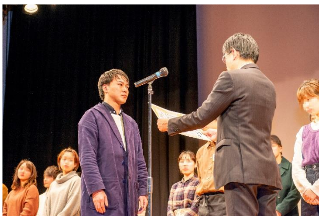
社長からの卒店証書授与の様子

株式会社入船（兵庫県加古川市）は2023年2月14日（火）、和食レストラン「ごちそう村」をはじめ当社が運営する飲食店を卒業するスタッフに感謝を伝えるイベント「卒店式」を神戸市長田区文化センターピフレホール（神戸市長田区若松町4）で3年ぶりに開催いたします。