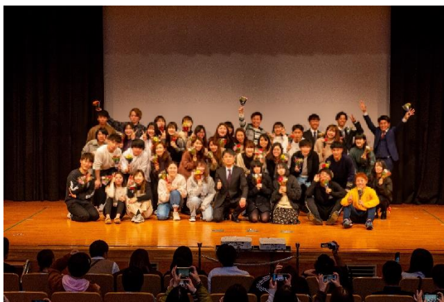
共に働いたスタッフの新たな門出を祝う