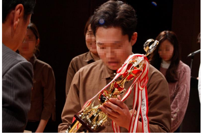
店舗別サービスコンテスト開催の様子