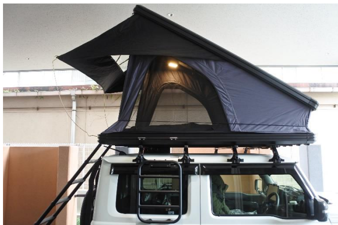
横から見たようす