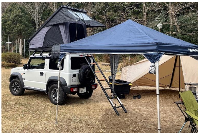
併設したテントでの施術も可能です