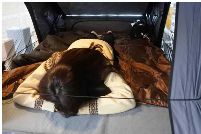
施術イメージ（身長152cm、女性）