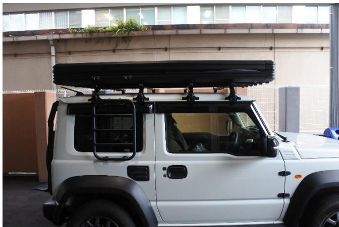
ルーフテントを閉じたようす