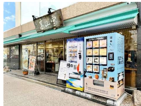
路面店の店頭にある自販機で販売