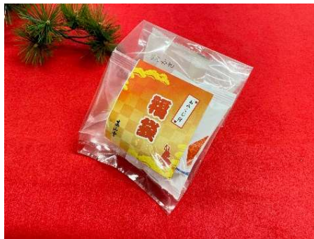
3つのランクがある「おみくじ付き福袋」