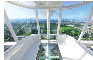
▲全面シースルーの Gondola からの絶景