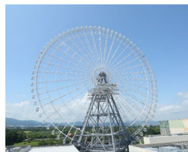
▲高さ日本一の大観覧車

定員: 6名(1基あたり) ※「VIP Gondola」は定員4名 1周所要時間: 約18分