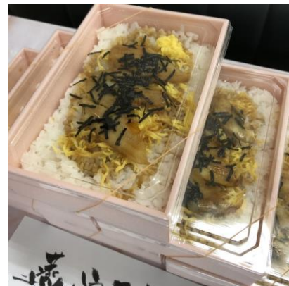
これまでのサプライズ献立 （左から、ハンバーガープレート、あなご重）