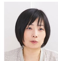
大阪大学医学系研究科 看護実践開発科学講座