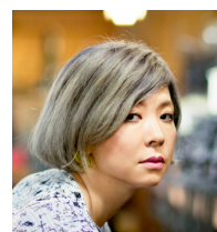
バイオアーティスト / 研究者 / 開発者