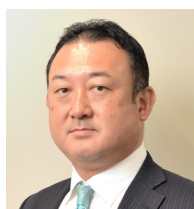
日本博覧会協会 機運醸成局長