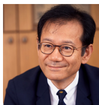
東京大学教授 / 慶應義塾大学教授