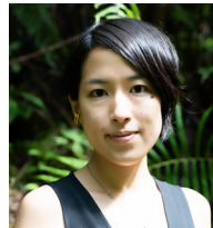
一般社団法人Whole Universe 代表理事