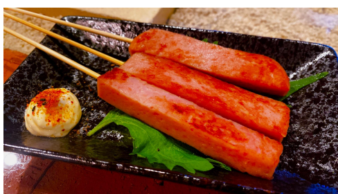
ビールや泡盛に！(スパム)