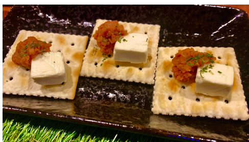
スパム味噌のカナッペ