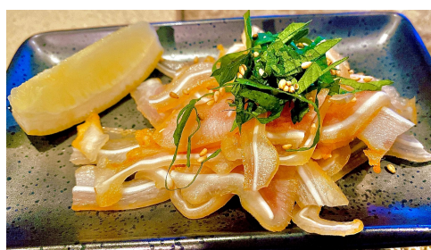
カクテルやチューハイにも！(ミミガー)