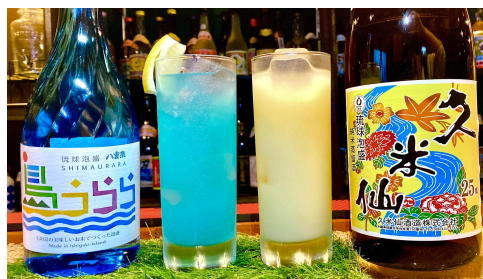
泡盛カクテル20種以上