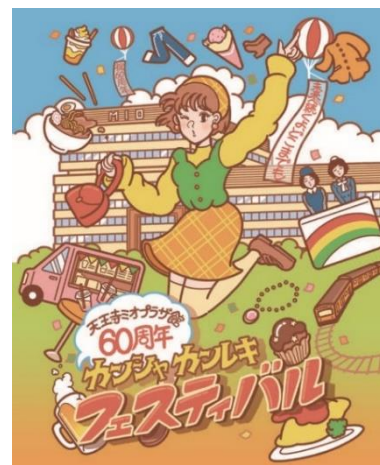
【メインビジュアル】