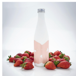
1位 酵素ドリンク MOEGI (いちご) ¥12,960(税込)