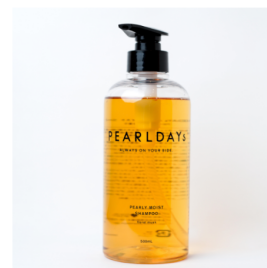
パールモイスト シャンプー PEARLDAYS ¥2,420 (税込)