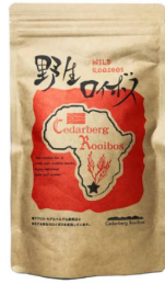
ルイボスティー 株式会社セダルベルグ・ロイボス ¥2,980 (税込)