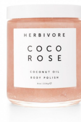
2位 シュガースクラブ (フェイス&ボディ) ¥5,940(税込)