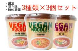
・醤油 ・胡麻種 ・酸辣湯種 3種類×3個セット ヴィーガンヌードル 9個セット T's Restaurant ¥2,331 (税込)