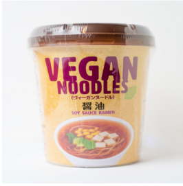
ヴィーガンヌードル (醤油) T's Restaurant ¥259 (税込)