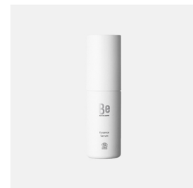
3位 エッセンスセラム Be for the earth ¥28,600(税込)