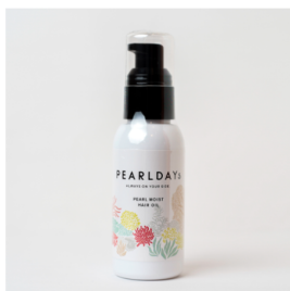
パールモイスト ヘアオイル PEARLDAYS ¥2,750 (税込)