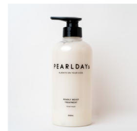
パールモイスト トリートメント PEARLDAYS ¥2,420 (税込)