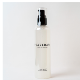
パールモイスト クレンジング PEARLDAYS ¥2,530 (税込)