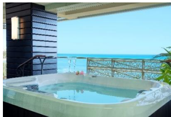
ワイキキビーチに臨む、各部屋の ラナイに備え付けのジャグジー