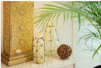
クラフトマンシップ溢れる こだわりのモロッカンランプ

エスパシオ ザ ジュエル オブ ワイキキは、日本ならではのおもてなしを使命と掲げ、究極のプライバシーを追求したラグジュアリーな空間（エスパシオ）をお届けする、唯一無二のホテルです。