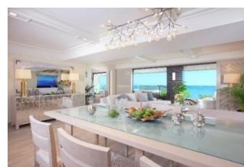
1つのフロアに1室のみ、各部屋 200㎡を超える贅沢なつくり