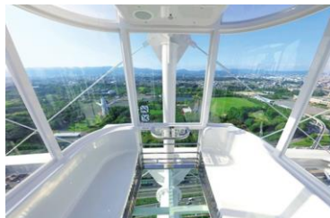
▲全面シースルーのゴンドラからの絶景