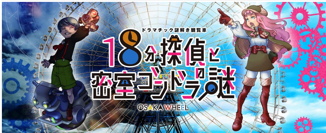
▲イメージビジュアル