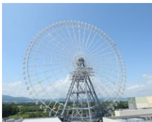
▲高さ日本一の大観覧車

開業(2016年7月1日)よりも早く6周年となるオオサカホイールは高さ日本一の大観覧車。世界でも屈指の高さを誇る観覧車として、「EXPOCITY」全体のランドマークとして誕生しました。全ゴンドラが床面シースルーで、まるで空中に浮かんでいるかのような雰囲気の中で、空からの抜群の眺望を楽しむことができ、全ゴンドラが冷暖房を完備、衛生対策も徹底した、最先端の観覧車です。