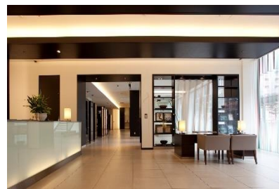
クロス・ウェーブ梅田 1階ロビー