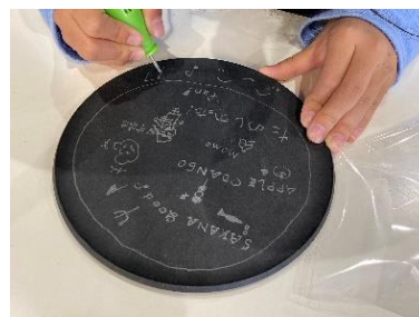
CHOPLATE® お絵かき体験 イメージ

陶器のような質感でありながら、そこからは想像できない軽さと、落としても割れにくい丈夫さを併せ持つ「CHOPLATE®」へ専用のペンで色々なデザインを描きこめるお絵かき体験ワークショップを開催します。好きなデザインを描いて、思い出に残る素敵なお皿に仕上げてください。