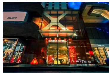
クロスホテル大阪

「この街、このホテルで過ごすかけがえのないひととき」をコンセプトに、大阪ならではの体験と、ホテルでの「今」を大切にし、ご滞在中に過ごすすべての時間を、他の街や他のホテルでは出会えない、かけがえのない時間へと高める、この街の良さを常に探求したサービスを提案するホテルです。また、なんばの中心地にある立地を生かし食やアート・音楽などを通して、地域文化や歴史の古さと新しさの融合を表現する活動を推進しています。多くの旅行者がこの場所で交流し、文化への理解が深まることで、地域活性化につながるよう、賑わい創出に貢献してまいります。