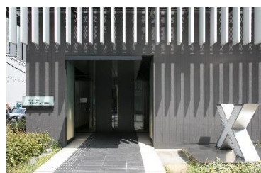
クロス・ウェーブ梅田

研修の効果を最大化して次世代リーダーを創る、研修・宿泊・食事が一体となった研修専門施設です。集中を高める＝Concentration、快適な環境を追求する＝Comfort、幅広い交流を生む＝Communication。これら 3 つの「C」をコンセプトに、研修を成功に導くため研修室、宿泊室、食事などサービス細部に至るまで、こだわりを追求しています。さらに、研修運営の専門知識と経験が豊富なカンファレンス・コーディネーターが常駐し、研修成功に向けて一社専任でコーディネートいたします。