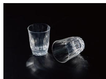
KINJO JAPAN E1