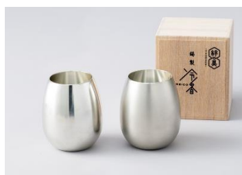
錫製タンブラー 冷香-reico- 磨・白上