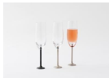
DOKURO エンジンバルブ シャンパングラス flauto