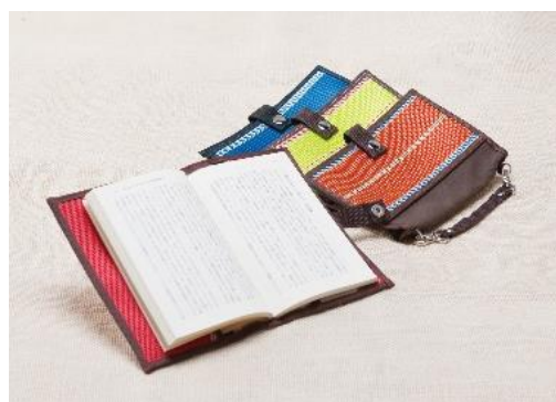
ハンドルブックカバー らうらうじ・second hose

本イベントでは、大阪製ブランド認定制度※1に基づき大阪府知事が認定した「大阪製ブランド製品」を期間限定で館内に展示します。地元「大阪」にある中小企業の製品を身近に感じていただき、大阪の企業の技術力、製品に込められた思いや価値をお伝えします。