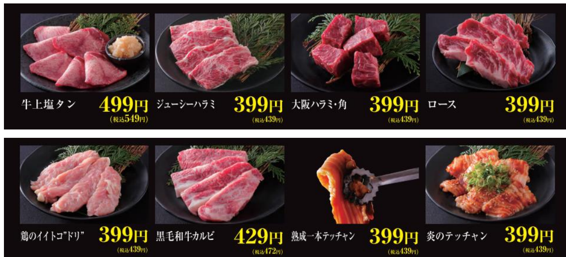
ディナー単品メニューの一例

ランチも、ライスやスープなどがついたお肉のセットが799円から〜と1,000円前後で楽しむことができる。