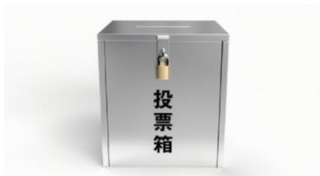
お店のレジ・ウェイティングルームで名前を募集