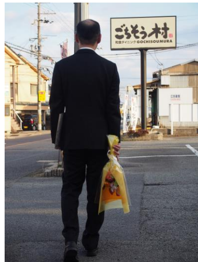
花束はご持参ください