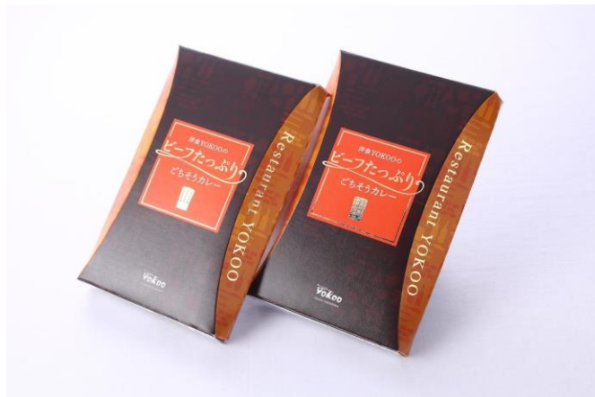
昨年 12 月に完成したビーフたっぷりごちそうカレー