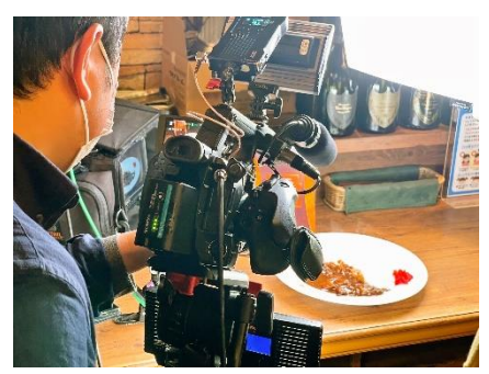
準備と撮影で2時間