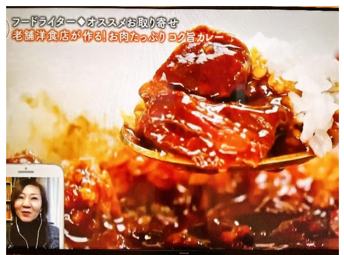
(放送映像) お肉たっぷりでおもしろい!