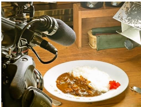
大きなカメラで撮影中