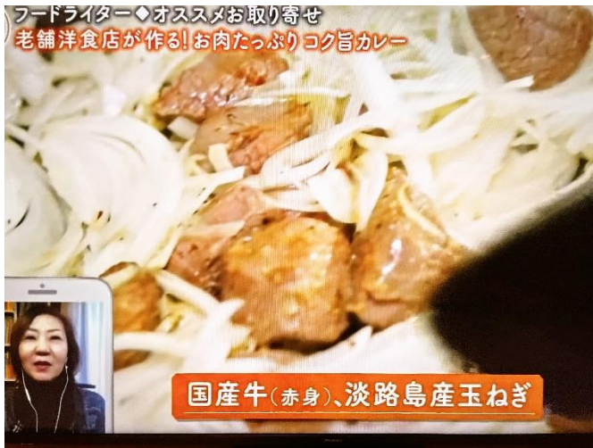
(放送映像) 国産牛と淡路島産玉ねぎを使用!