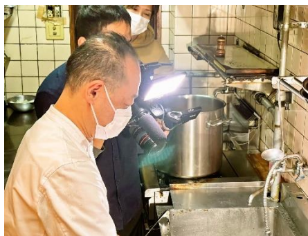
キッチンでの様子も撮影