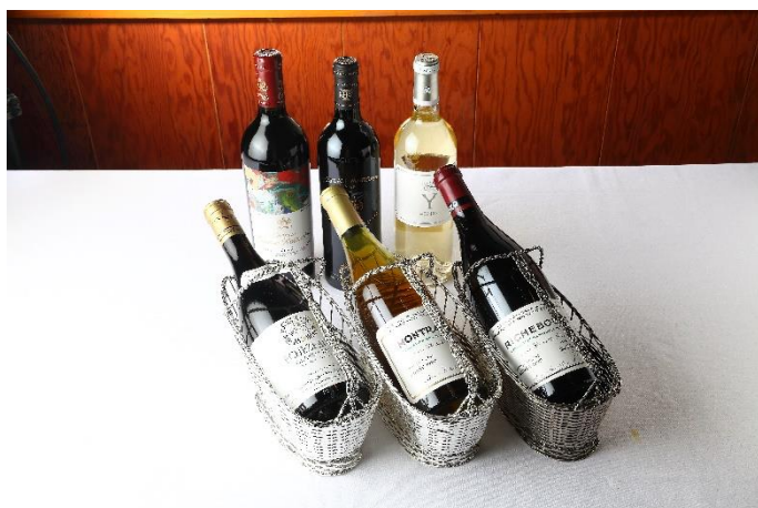
厳選した銘醸ワインを適正価格にてご提供いたします