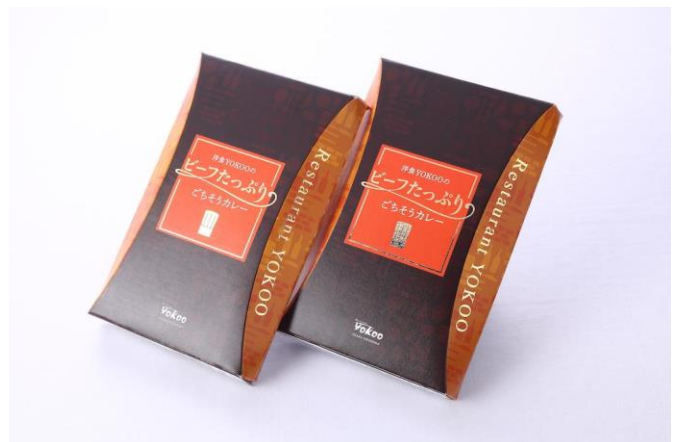
そのままプレゼントにも出来るパッケージ