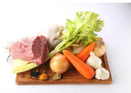
厳選したカレーの素材