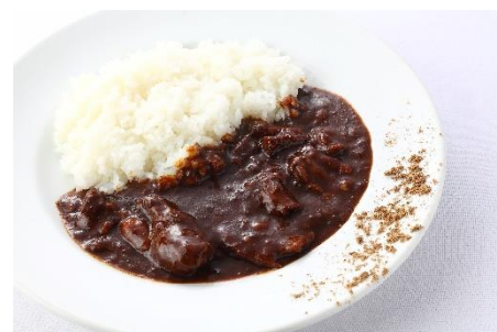
お肉がしっかり入っています