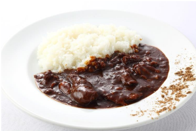
お店特製のスパイスが付属します

洋食店 YOKOO 福島本店、新大阪駅改札内 YOKOO 大阪のれんめぐり店、YOKOO パナソニックスタジアム店の3店舗を展開する株式会社ヨコオ（住所：大阪市福島区福島 6-14-4）は、お店で人気のカレーをご家庭でお楽しみ頂けるようオンラインストアで販売を開始致します。