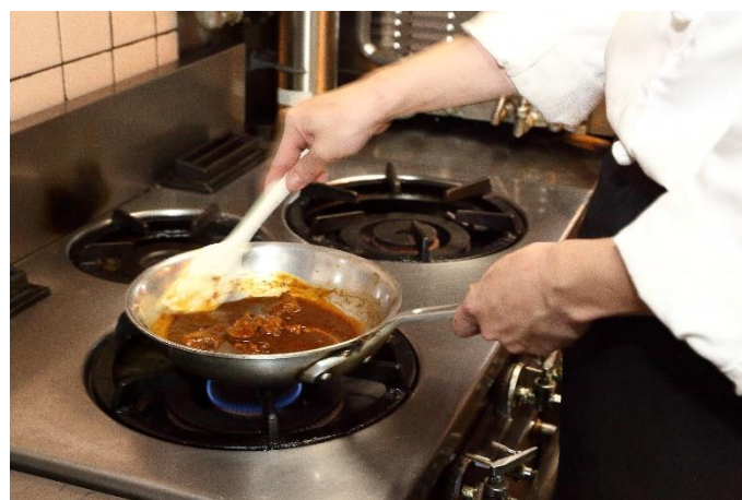
付属のスパイスを弱火で先に軽く温めるとさらに美味しくなります!