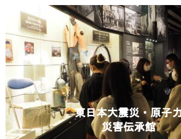
東日本大震災・原子力 災害伝承館