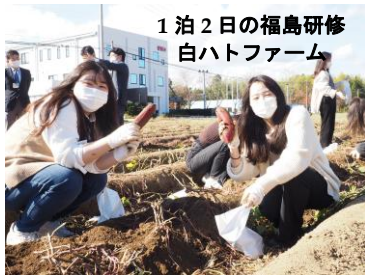
1泊2日の福島研修 白ハトファーム