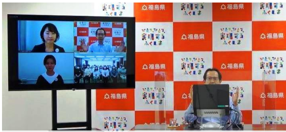
9月17日内堀福島県知事とのオンライン表敬