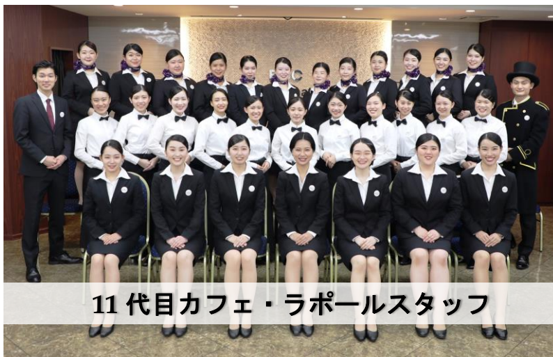
11代目カフェ・ラポールスタッフ

ECC 国際外語専門学校（大阪市北区 学校長：瀧山 淳一）ホテル・観光学科ホテルコース生が企画・運営するカフェ「Café Rapport カフェ・ラポール」を、12月3日～5日に期間限定で開催いたします。東北地方太平洋沖地震で被災した福島県の復興支援を目的に始めた同カフェは、今年で11回目。これまで、9,256名が来店し、663万5,087円を福島県に寄附しております。