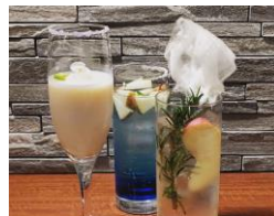
学生が考案、福島県産品を使用した オリジナルモクテル 500円