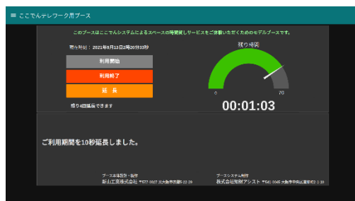
延長操作受付時画面