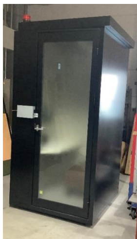
モデルブースの外観

実用化への道を拓くために、モデルブースのユニークな特徴を多くの方に知っていただきたいと思い、ここにお知らせを申し上げます。