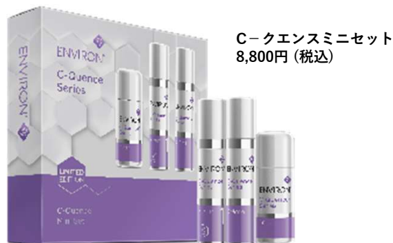
C-クエンズミニセット 8,800円(税込)