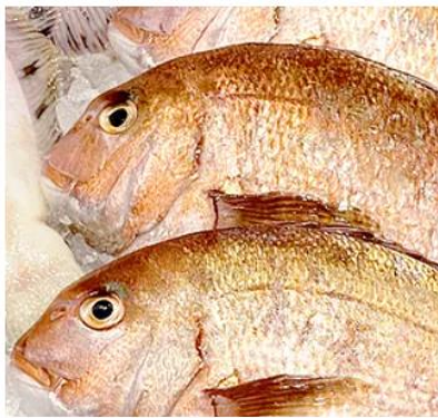
4月 桜ダイor旬の魚種 30～40cmを 2～3尾発送予定