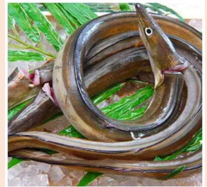
6月 八モor旬の魚種 3本発送予定

※鮮魚BOXは年間9回で、提供時期及び内容は、基本的には漁師さんおまかせとなります ※漁師さんおすすめレシピや地元だけの食べ方、魚の捌き方なども同封します