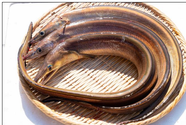
届く魚の一例：八毛