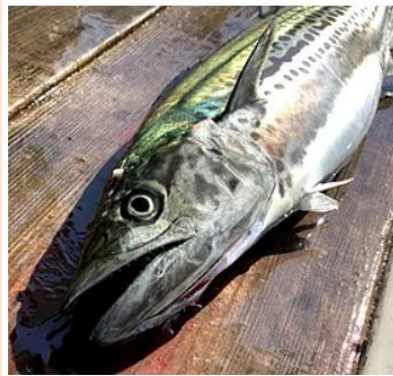
5月 春のサワラor旬の魚種 60～1m位を 1本（白子かマコ付）発送予定